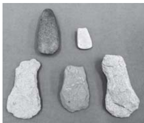
磨製石斧(上)・打製石斧(下)