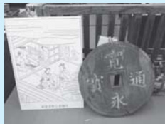
寛永通宝を模した 両替商の看板

郷土資料室では、3月に国史跡に指定された下野谷遺跡の出土品など、古代から現代までの貴重な資料を展示しています。