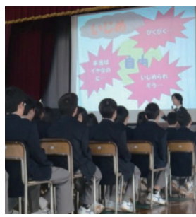
「いじめ防止の授業」の様子

○いじめ防止に関する情報モラル教育を充実させるためのデジタルコンテンツを全校に配信します。 ・中学校第一学年で、弁護士による「いじめ防止の授業」を行います。