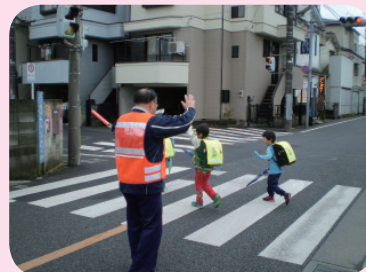
防犯ベストと腕章の活用事例(芝久保小)