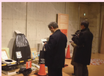
タブレット端末で学習します

協議会では、今後も、市民の皆さまとともに、地域の防災力の向上に取り組んでいきます。