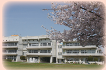
満開の桜が新入生を出迎えました

ている様子でした。教育委員会では、学校、家庭、地域の皆さまと一体となって、あらゆる場面で児童・生徒の健やかな成長を支援していきますので、ご理解、ご協力をお願いします。