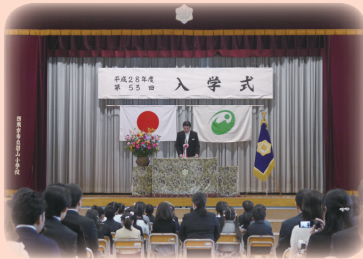
校長先生のお話を真剣に聞きました

ている様子でした。教育委員会では、学校、家庭、地域の皆さまと一体となって、あらゆる場面で児童・生徒の健やかな成長を支援していきますので、ご理解、ご協力をお願いします。