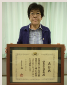
表彰状を手にする 奈良図書館長

この表彰を励みに、これからも子どもの読書活動を推進する活動を充実させてまいります。