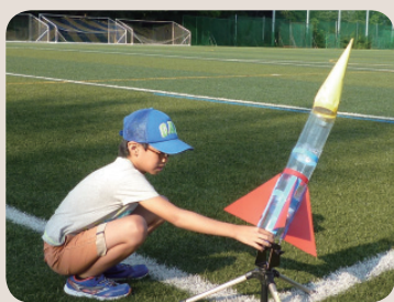
ペットボトルで作ったロケット 飛距離を競いました

を発見したりと、普段、小学校ではなかなか体験できない貴重な時間となりました。11月26日(土)に実施予定の第2回の教室はすでに募集を終了していますが、来年度も実施予定ですので是非、親子一緒にご参加ください。