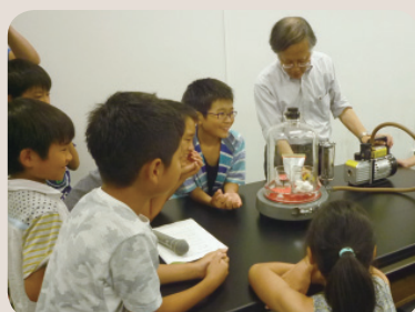
常温の水を真空状態にすると...?

7月30日(土)、早稲田大学高等学院で第1回理科・算数だいすき実験教室が行われました。早稲田大学の協力のもと、平成19年度から開催されているこの教室は、早稲田大学高等学院の設備を使い本格的な実験ができると毎回好評です。第1