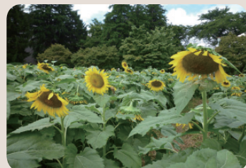
ひまわり迷路の写真

ひまわり事業は、谷戸小学校・谷戸第二小学校の子どもたちと市民、市民活動団体の皆さんと一緒に取り組んでいます。