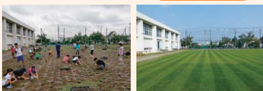
児童と苗植え(平成25年7月)