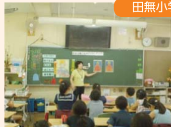
食育の授業の様子