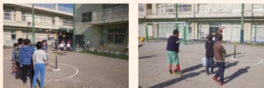
友達と一緒にバッティング練習をしています。