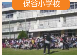
村上選手の試技に、子どもたちは大興奮!