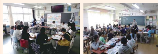
小・中教員の合同研修会を繰り返し行いました。