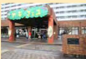
第6回ヤギフェス!の様子

ステージでは、公民館利用団体や地域で活躍する方たちの発表を見ることができます。ロビーでも楽しい催しを行います。