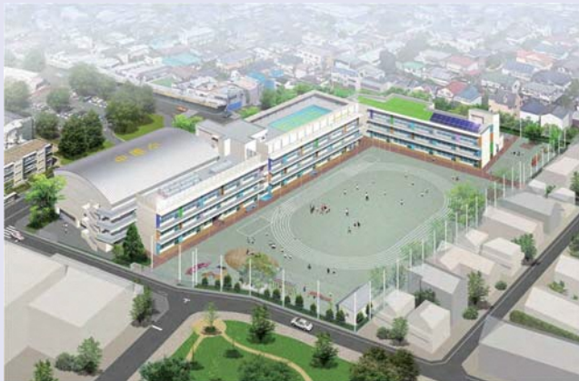
中原小学校完成予定図