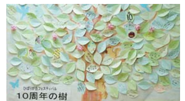
出演者や来場者からのメッセージ

今後も、活動の成果を発表する場、市民相互の交流の場となるフェスティバルを、利用団体と協働して作り上げていきます。