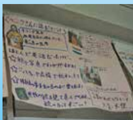
市内在住の英語の先生にインタビュー!

さらに、防犯効果を高めるため、防犯カメラの存在を周知する看板を、カメラ1台に対し3枚程度掲出しています。