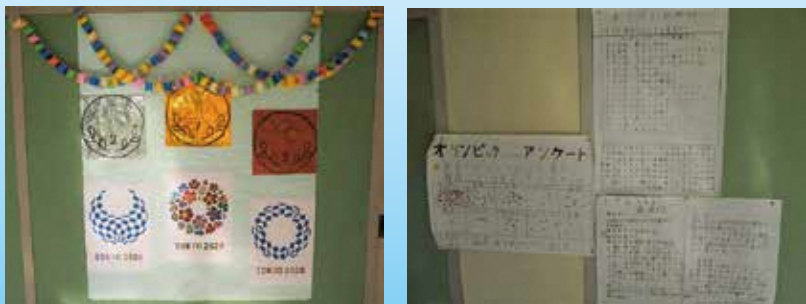
谷戸二小オリパラロードの展示物

各クラスにオリンピック・パラリンピック係を作り、係の児童が中心となってオリンピック・パラリンピックの歴史や種目について調べています。調べたことを校内の掲示や発表会などで発信しています。