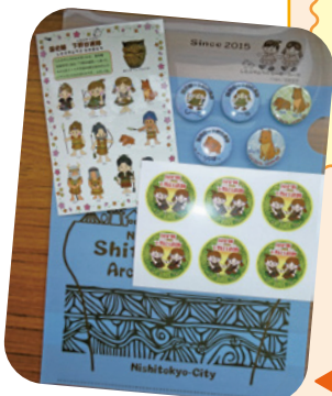
◀イベント参加者プレゼント

今年の夏は郷土資料室で、ゆっくりと西東京市の歴史に触れるひと時を過ごしてみませんか。