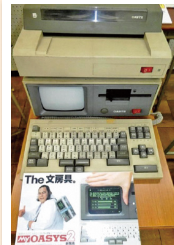
◀38年前に発売されたワープロ 展示室3「道具くらべの部屋」