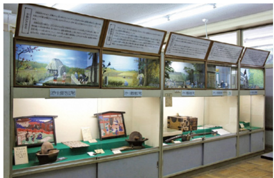
歴史ジオラマ 展示室4「西東京市の歴史を知る部屋」

毎年、夏の期間中には、子どもたちが楽しみながら歴史に触れることができる特別企画を行います。ぜひ郷土資料室にお越しください。