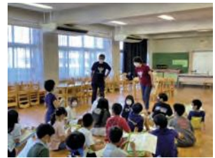
インタビューの様子