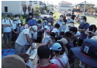
魚の解体ショーの様子

新型コロナウイルス感染症の影響により、3年ぶりとなる現地での開催でしたが、以前と変わらず大盛況のイベントとなりました。