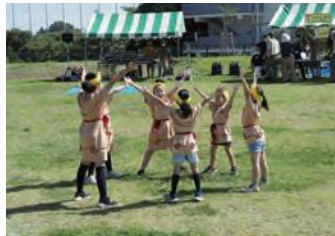
したのや縄文体操の様子