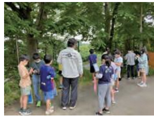
フィールドワークの様子

インタビューでは、19個の質問がありました。学芸員と対話することで、より質問を掘り下げながらインタビューを行うことができ、その後のまとめ学習につながる授業となりました。