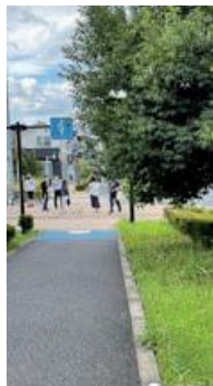
通学路の合同安全点検の様子

市立小学校では、毎年、学校関係者、警察署職員、道路管理者、教育委員会事務局職員による通学路の合同安全点検を行っています。交通安全をメインに、防犯、防災の観点からも具体的な対策を協議し、状況に応じた対策を実施しています。