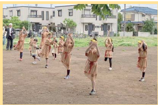
セレモニーの様子 (ココスポ!じょうもんず♪によるしたのや縄文体操)