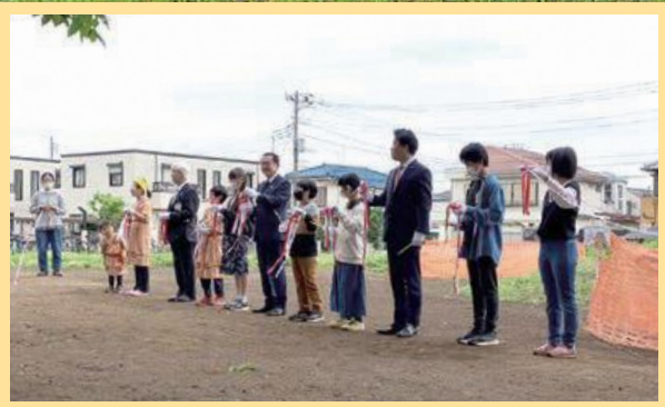
セレモニーの様子(テープカット)