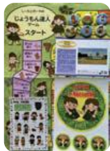
イベント参加者プレゼント

今年の夏は、郷土資料室でゆっくりと西東京市の歴史に触れるひとときを過ごしてみませんか。