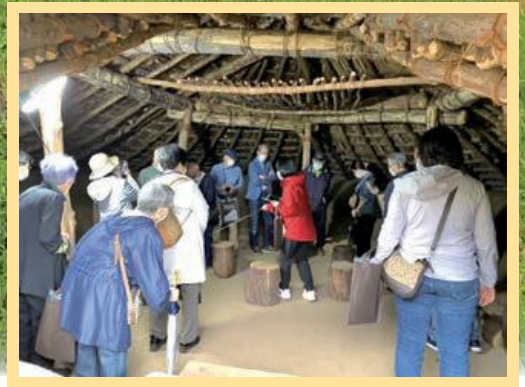
見学会の様子(竪穴式住居の内部)