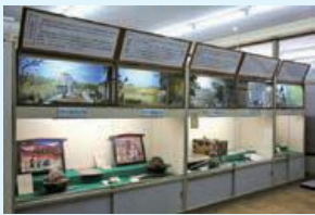
歴史ジオラマ (展示室4 歴史をジオラマで知る部屋)

この夏の期間中には、楽しみながら歴史に触れることができる特別企画を行います。ぜひ郷土資料室にお越しください。