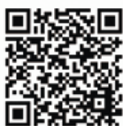
子ども電子図書館 利用案内