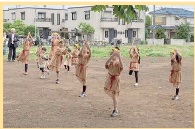
セレモニーの様子 (ココスポ!じょうもんず♪によるしたのや縄文体操)