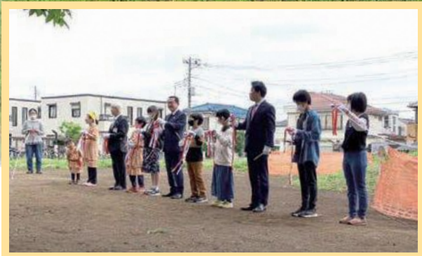
セレモニーの様子(テープカット)