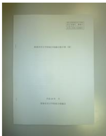
↑会議で配布された「西東京市立学校統合協議会提言書（案）」