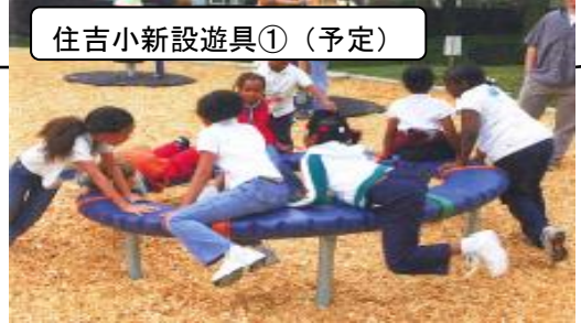
住吉小新設遊具①(予定)