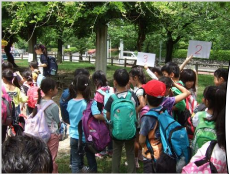
↑遠足で一緒に山に登りました。 みんなで仲良く楽しいな(^0^)