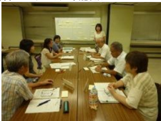
写真 ワークショップ実施状況