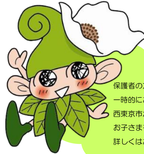
西東京市マスコットキャラクター「いこいーな」 ©シンエイ/西東京市

保護者の方が病気や育児疲れなどで、 一時的にお子さまの養育にお困りの時、 西東京市が委託している児童養護施設で お子さまをお預かりします。 詳しくはお問合せください。