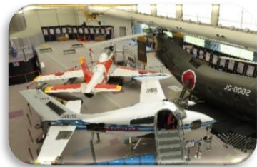
フライトシミュレーターを体験