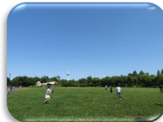
みんなでドッチボール