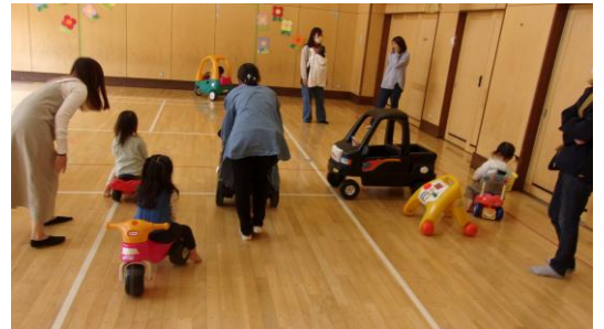
(わくわくキッズランドのようす)