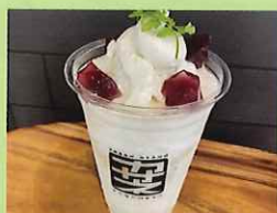
~夏バテ予防にピッタリ!!~ 梨スムージー 420円 保谷中学校2年生提案