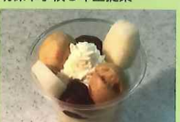
なしシュークリーム(パフェ風) 380円 谷戸小学校4年生提案