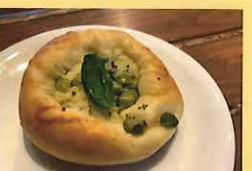
バジルと枝豆の丸パン 160円 げやき小学校5年生提案