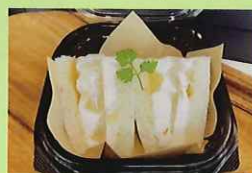
西東京の梨で一息。 380円 明保中学校3年生提案