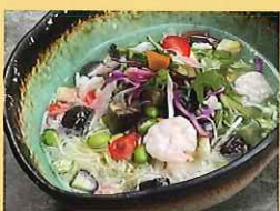
夏野菜のさっぱり冷麺 1,298円 明保中学校1年生提案 ※冷麺はテイクアウトできません。