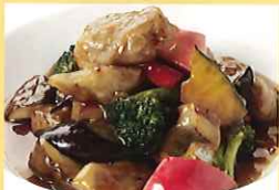
色とりどり夏野菜の豚 1,518円 ひばりが丘中学校2年生提案