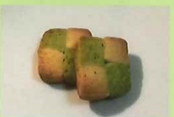
ほうれん草(小松菜)のクッキー 1枚 60円 明保中学校3年生提案

東町 3-11-2 グランドハイム保谷 110号 TEL : 042-425-3818