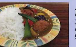
夏野菜たっぷりカレーライス 600円 東伏見小学校5年生ほか提案