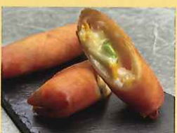
枝豆とコーンの春巻 2本 572円 ※追加は1本286円 田無小学校4年生提案