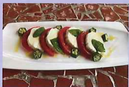
天の川カプレーゼ 979円 保谷中学校1年生提案