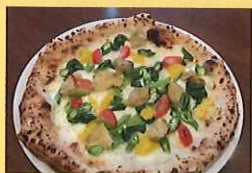
西東京夏野菜たっぷりピザ 1,540円 保谷小学校4年生ほか提案