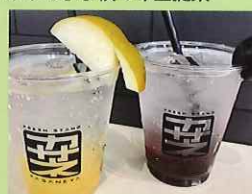
西東京さわやか フルーツジュース 300円 保谷第一小学校6年生提案