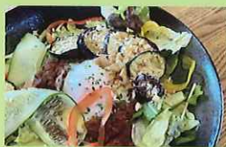
トマトのカレー 950円 明保中学校1年生提案