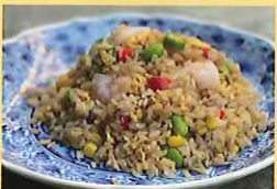
夏野菜チャーハン 1,298円 本町小学校3年生ほか提案