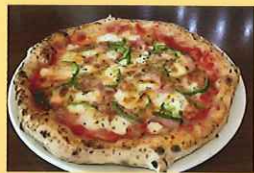
チーズいっぱいピザ 1,540円 中原小学校3年生ほか提案

下保谷 4-8-18 AnnexManor1F / TEL : 042-439-9560