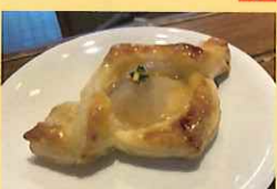
ゴロゴロ梨デニッシュ 160円 明保中学校3年生提案