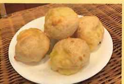
じゃがいもたっぷりボンデケーキ 1個 50円 東伏見小学校5年生提案