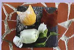
西東京野菜入り チョコレート! 418円 芝久保小学校4年生提案