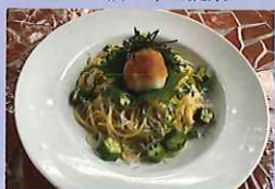
しらすおろしさっぱりスパゲティ 1,408円 上向台小学校6年生提案