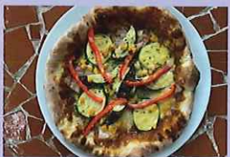
みんな大好きスパイシー夏野菜ピザ 1,518円 東伏見小学校4年生提案