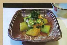
夏バテ防止!! 夏野菜の さっぱりやきなす 550円 ひばりが丘中学校2年生提案