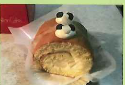
西東京フルーツロールケーキ 680円 明保中学校3年生提案