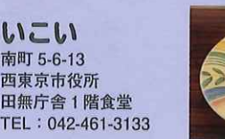
いこい 南町 5-6-13 西東京市役所 田無庁舎 1階食堂 TEL : 042-461-3133