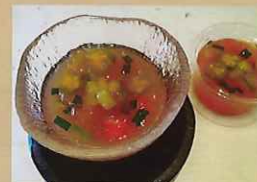
カラフルなトマトゼリー 350円 ひばりが丘中学校1年生提案