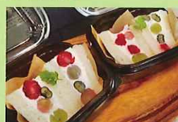
西東京市旬の食材 サンドイッチ 450円 げやき小学校4年生提案