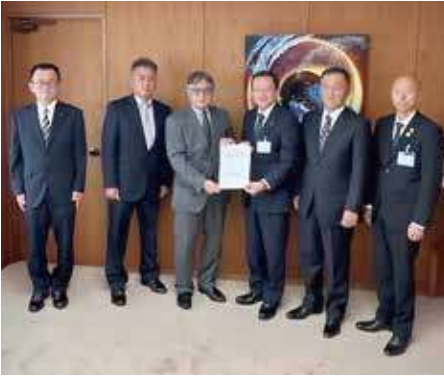
（左より：下田編集部会長、中野農地部会長、保谷会長、池澤市長、野口会長職務代理、萱野副市長）