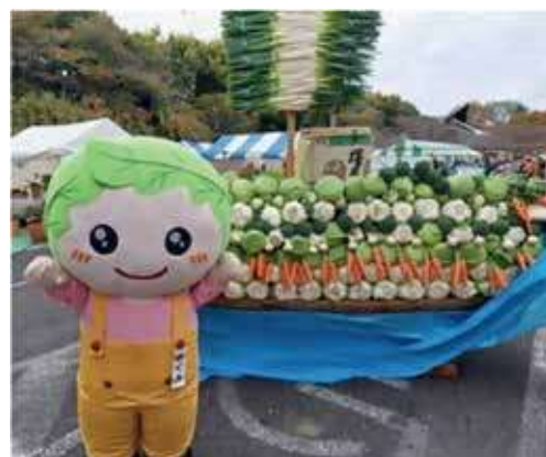
めくみちゃんと宝船

は296点(野菜106点、植木190点)の展覧がありました。今年も異常な暑さや豪雨などに見舞われましたが、出展された農産物は見事な出来栄のものばかりで、生産者の努力、技術力の高さが感じられました。