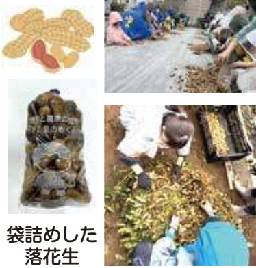
袋詰めした落花生