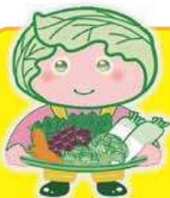
西東京市農産物キャラクター 「めくみちゃん」