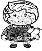
西東京市 農産物キャラクター 「めぐみちゃん」