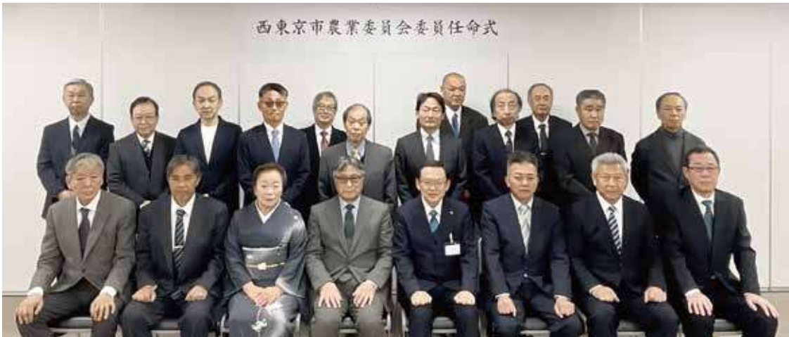
西東京市農業委員会委員任命式

農家にとって厳しい状況が続きますが、農業に関する情報等をできるだけ迅速に生産者に伝え、新たに任命された農業委員が丸となり、行政と共に諸問題の解決に努力していく所存です。