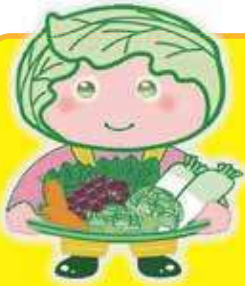
西東京市農産物キャラクター 「めくみちゃん」