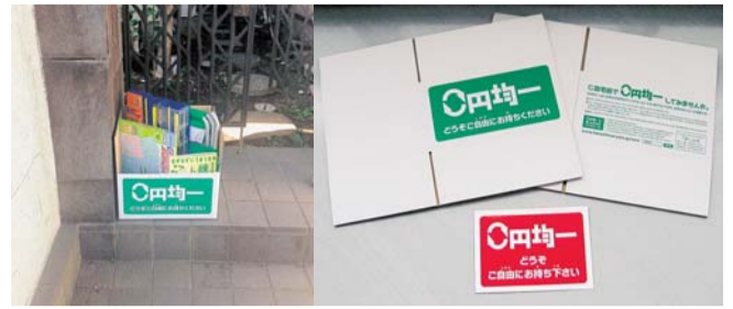
「0円均一」の商標が入ったダンボール箱は、エコプラザ西東京で配布しています。

まず、ご自宅の不要品（ごみじゃないけど、もはや我家に必要無い物など）を集めましょう。自宅玄関先に、不要品を入れ「0円均一」の商標を貼った箱などを置きます（イメージ参照）。あとは、通りすがりの方に箱の中の不要品を自由に持って行ってもらいましょう。もし他の場所で「0円均一」を見かけ、自分の欲しい物があったら、遠慮なく頂戴しましょう。箱の中の不要品が空っぽになったり、もうこれ以上引き取り手がない様子でしたら、きりのいいところで、箱を自宅内に片付けましょう。