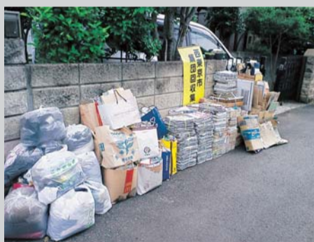
奨励金は、生活用品・清掃用具・活動費などに使われています。