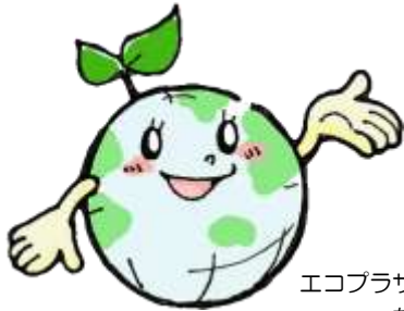
エコプラザ西東京キャラクター ちきゅうくん