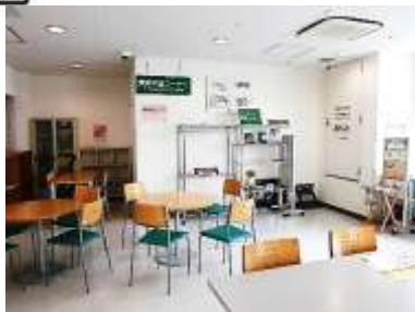
環境学習コーナー