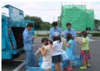
パッカー車の前で