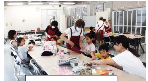
夏休み自由研究の様子

また、その他に次のような常時活動も行っていますので、エコプラザ西東京をお気軽にご利用いただきたいと思います。