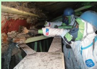
吹付け石綿の除去作業の様子