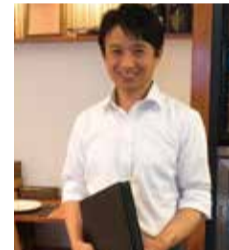
シニアソムリエや1級レストランサービス技能士などに認定される伊奈オーナー

ムのおナーおすすめ料理。骨付き鶏もも肉に岩塩・黒こしょう・んにく・ローリエを入れ一晩寝かせる。豚の背脂からとったラードでじっくりと低温で火を入れ、冷ました後にラードごと保存する手間をかけた逸品だ。 ボトルワインはフランスワインを中心に67種類。グラスワインは7銘柄用意されている。より多くの人に気軽に味わって欲しいとグラスワインは全て600円で提供している。 ランチはアミューズ(小前菜とメインディッシュにスー