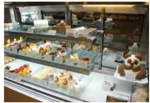
バリエーション豊富なフランス菓子が並ぶ