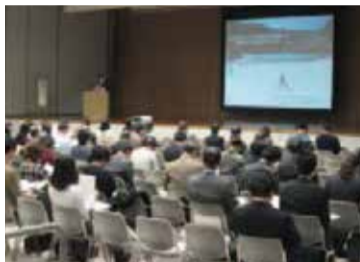
平成27年度 病院管理講習会・患者相談窓口担当者講習会