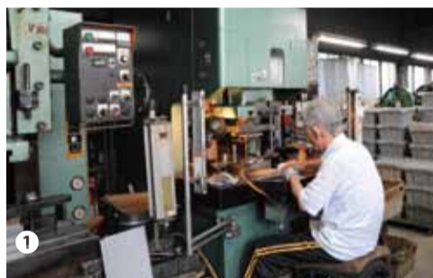
①熟練の技を駆使し、板バネのプレス加工を行う