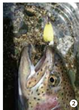
②新製品のスプーンはニジマス釣りに最適