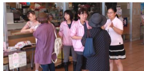
ひばりヶ丘駅でのピンクリボン運動