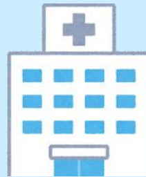
訪問看護ステーション