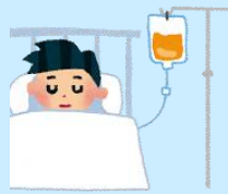
医療的ケアの必要な 重症心身障害児