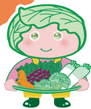
西東京市農産物キャラクター「めぐみちゃん」

※掲載しているイラストはご応募いただいたメニューの一部で、限定販売されるメニューとは限りません。