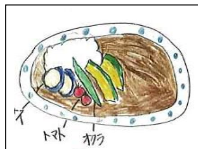
「夏野菜たっぷりカレーライス」