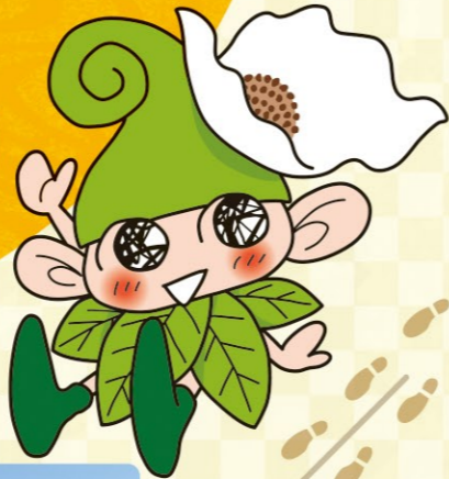
IKOI-NA © SHIN-EI / NISHITOKYO-CITY

「IKOI-NA」는 자연과 생물의 만남을 지키는 숲의 요정입니다. 「니시도쿄 이코이노리 공원」에 살고 있습니다. 시의 이벤트 등으로 보이던 사진을 찍거나 악수하거나 해 주세요.