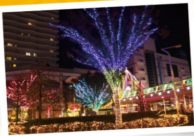
다나시역 앞 일루미네이션 (11월 중순~12월)