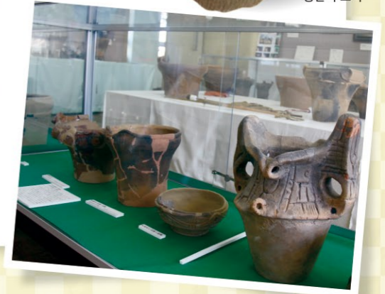
다이나믹한 장식의 승판석 토기