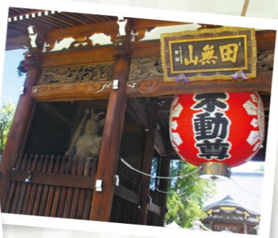
시 지정 문화재의 느티나무