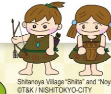
Shitanoya Village "Shita" and "Noya"

시내의 향토 자료를 수집·보관·전시하는 시설로서, 시타노야 유적의 출토품을 비롯한 구석기 시대의 석기와 조몬 시대의 토기, 무로마치 시대의 판비석과 에도시대의 고찰 등, 그 외에도 얼마 전까지 사용되었던 농기구와 도구도 전시되어 있습니다.