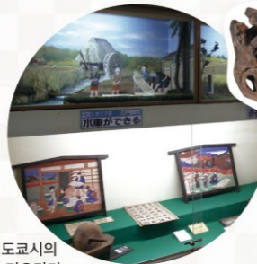
니시도쿄시의 역사 디오라마