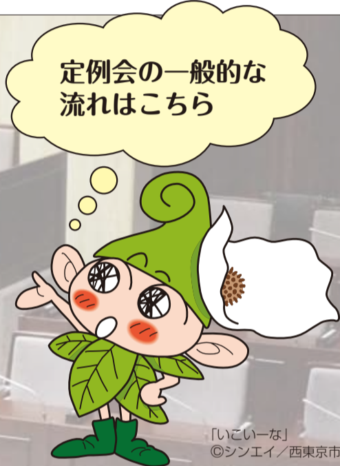
「いこいな」