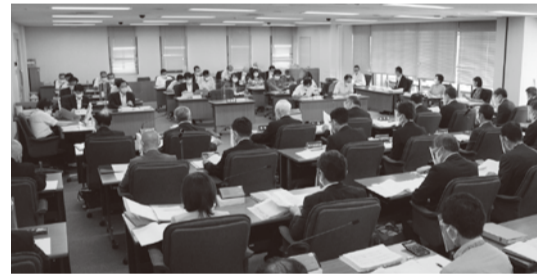
パーティションやフェイスシールド等による感染症対策に努めながら審査しています