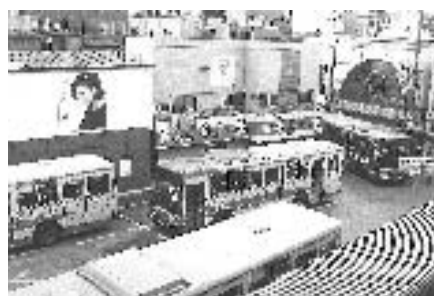
保谷駅南口・駅前広場

【質問】 起債95%、交付税措置70%である総額320億円の合併特例債を最大限活用することが、合併の効果である。この3年間で約110億円を使ったが、今後、新市建設計画の見直しに当たり残りの財源をどう有効活用するのか伺う。 【答弁】 基本構想をお認めいただいた後、市民の皆様のご意見をお聞きしながら新市計画の見直しを図りたい。 【質問】 保谷駅南口の再開発は事業決定に向けて大きくおこなわれている。権利者との調整、権利変換モデル、保留地処分計画、資金計画で足踏みしていると思われるが、今後の見通しはどうか。 【答弁】 住宅保留地は協議が進んでいる。