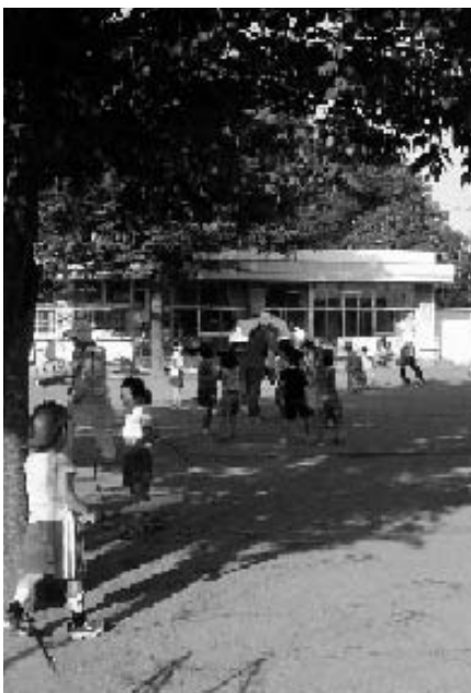
外で思い切り遊ぶ子どもたち(けやき保育園)

【答弁】 関係法令に基づき進めるので考えていない。 【要望】 安全性が確立するまで市民に選択させる横浜方式を検討せよ。 【質問】 振興基金活用は市民公募で 【質問】 まちづくり整備基金は緑化基金、福祉施設整備基金など目的別に再編せよ。 【答弁】 総合計画の原資なので効果的運用を検討する。 【質問】 振興基金の活用は市民発の企画・実践の支援を。 【答弁】 提案に沿って研究、教育計画への市民参加 【質問】 生活者ネットの調べで教育のニーズ調査が必要と答えた人は7割だった。行政でニーズ調査を行え。 【答弁】 教育計画策定懇談会の中から要望は把握できる。 【質問】 今のやり方で多様な意見が把握できるか疑問。市長部局と同様に市民参加条例に沿って市民懇談会やパブリックコメントをやれ。 【答弁】 聞き置く。 【質問】 地教法改正で教育委員の構成を多様化することが盛り込まれた。公募制導入の考えはないか。 【答弁】 研究したい。