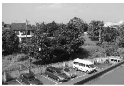
住吉公民館裏都営住宅跡地

いるが、非行防止の特効薬はない。まず第一義には親が保護者の責任を自覚した上で、家庭と学校、地域が連携し子どもを見守っていく必要がある。 【質問】 アスタビル周辺の交通渋滞は一向に改善されず、影響は旧青梅街道に及び、歩行者も近隣商店も非常に迷惑を受けて困っている。改善策は。 【答弁】 これまで銀行駐車場の休日借り上げ、係員増員による整理や民間駐車場への誘導、チラシ配布や、納品車は入り口前2台待ちに抑えるなど努力してきた。今後とも関係者と協議していきたい。