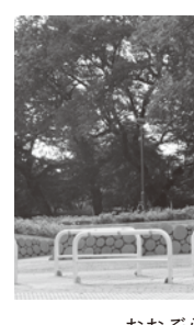
おおぞら公園(新町3丁目)

[質問] 行政改革として、事務の委託化等、民間活力の活用は可能な範囲で進めるべきだ。 [答弁] 先進自治体の事例研