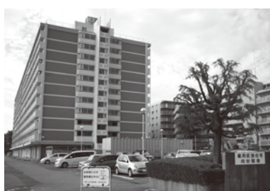
雇用促進住宅向台宿舎(向台町4丁目)

[質問] 行政改革として、事務の委託化等、民間活力の活用は可能な範囲で進めるべきだ。 [答弁] 先進自治体の事例研