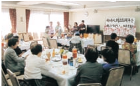
新婦人創立50周年を祝うつどい（西東京支部）