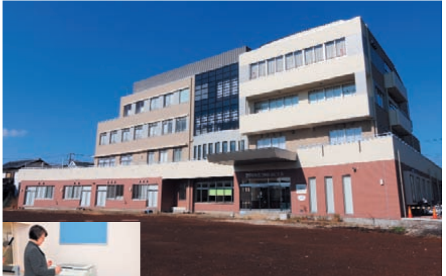
前庭は現在整備中