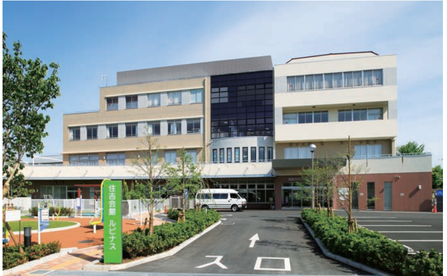
整備された正面玄関