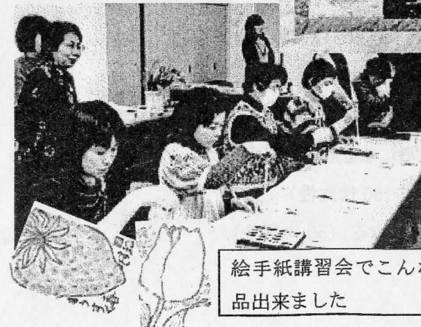
絵手紙講習会でこんな作 品出来ました