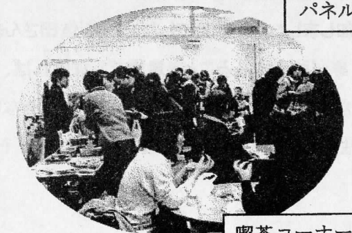
喫茶コーナーでひと休み