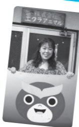
エクラアニマルの車のボンネットには、キャラ丸君などのイラストが描かれている