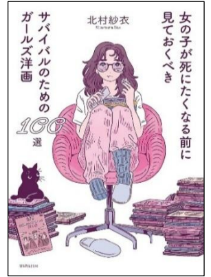
女の子が死にたくなくなる前に見ておくべき サバイバルのためのガールズ洋画 北村紗衣／2024年 書肆侃侃房 分類 21-b (子ども 児童書)