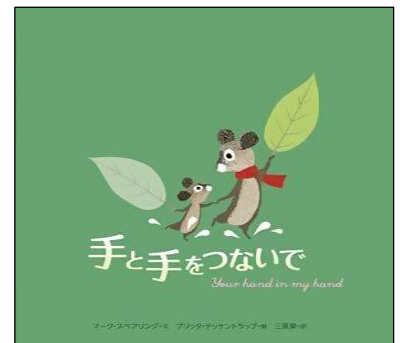
手と手をつないで マーク・スプリング文、ブリッタ・テックントラップ絵 三原泉訳 2016年／BL出版 分類 21-a (絵本)