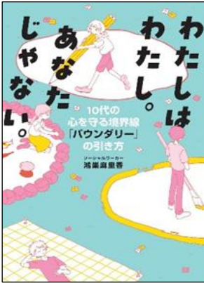
わたしはわたし。あなたじゃない。 10代の心を守る境界線「バウンダリー」の引き方 鴻巣麻里香／2024年 リトルモア 分類 21-c (子ども 人権)