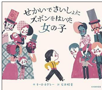
せかいでさいしょにズボンをはいた女の子 キース・ネグレイ作・石井睦美訳 2020年／光村教育図書 分類 21-a (絵本)