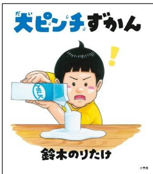
大ピンチずかん 鈴木のりたけ 2022年／小学館 分類 21-a (絵本)