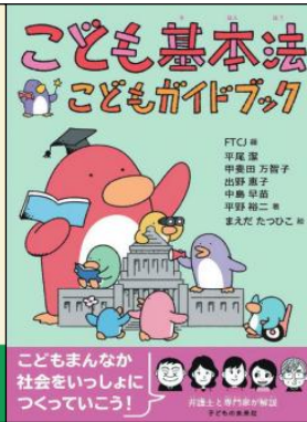
子ども基本法 子どもガイドブック 佐藤香代ほか2名／2024年