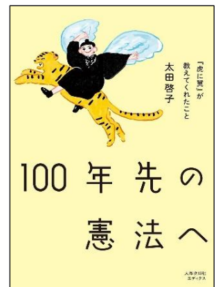
「虎に翼」が 教えてくれたこと 太田啓子/2025年 太郎次郎社エディタス 分類9(人権)