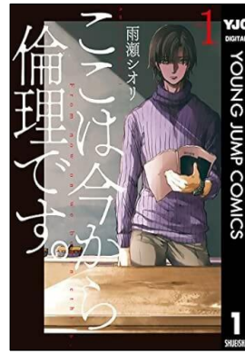
ここは今から倫理です。 雨瀬シオリ／2017年 集英社 分類 23 (コミック)