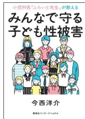
小児科医「ふらいと先生」が教える みんなで守る子ども性被害 今西洋介/2024年 集英社インターナショナル 分類5(身体・性)