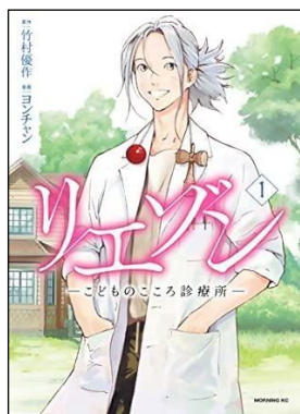
リエゾン—子どものこころ診療所—1 原作・漫画ヨシチャン・原作竹村優作 2020年/講談社 分類23(コミック)