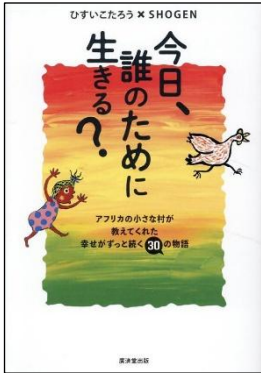
今日、誰のために生きる？ アフリカの小さな村が教えてくれた しあわせがずっと続く30の物語 ひすいこたろう×SHOGEN 2023年／廣済堂出版 分類 7 (生き方)