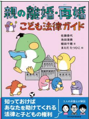
親の離婚・再婚 子ども法律ガイド 佐藤香代ほか2名／2024年

よくわかる子どもと法律入門セット (全3巻) こどもの未来社／分類 21-C (子ども 人権)