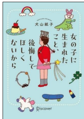
女の子に生まれたこと、 後悔してほしくないから 犬山紙子/2025年 ディスカヴァー・トゥエンティワン 分類1(子育て)