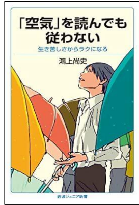
「空気」を読んでも従わない 生き苦しさからラクになる 鴻上尚史／2019年 岩波ジュニア新書 分類 21-c (子ども 人権)