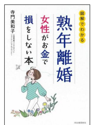
図解でわかる熟年離婚 女性がお金で損をしない本 寺門美和子/2025年 河出書房新社 分類2(家族)