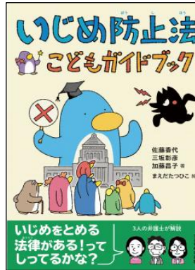
いじめ防止法 子どもガイドブック 平尾潔ほか4名／2023年