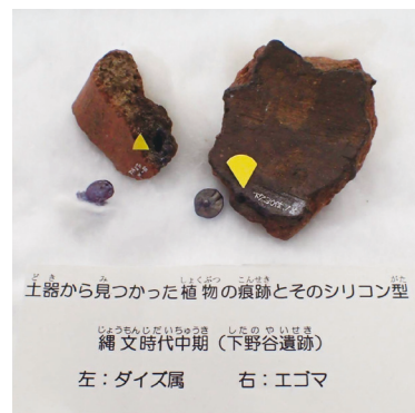
土器から見つかった植物の痕跡とそのシリコン型

れを何年も何年も繰り返すと、野生種より大きな大豆へと育っていくのです。下野谷遺跡から出土した土器の庄痕(土器に残ったくぼみ)の調査で、現代の大豆に近いぐらい大きなツルマメの痕が見つかっています。したのや村には栽培名人がいたのかもしれませんが。